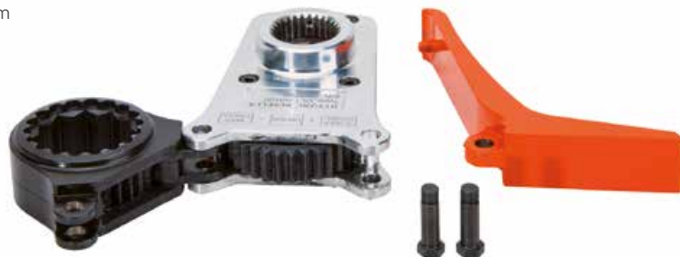
Offset Link, Ringschlüssel, Abstützarm – flach, leicht und schnell

HYTORC Offset Link bietet absolute Flexibilität und einen vielseitigen Einsatz an nahezu allen Verschraubungsanwendungen. Die Antriebseinheit kann mit leicht wechselbaren Doppelsechskanteinsätzen ausgestattet werden, die ein schnelles Auf- und Umsetzen gewährleisten. So können alle Schlüsselweiten von 30 mm bis 80 mm sowie von 1-1/4" bis 3-1/8" abgedeckt werden. Offset Link kann aber auch für die hydraulischen Drehmomentschrauber ICE und AVANTI verwendet werden. (siehe Katalog „Mobile hydraulische Verschraubungstechnik“).