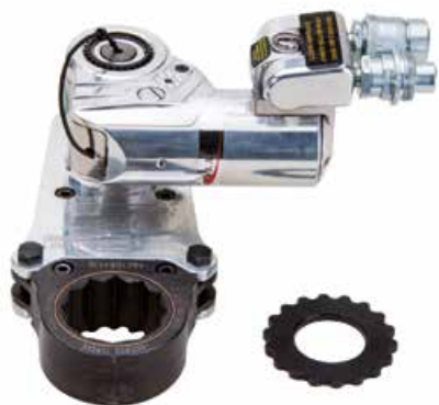
ICE-1 mit Offset Link und zWasher zum Verschrauben ohne Abstützarm